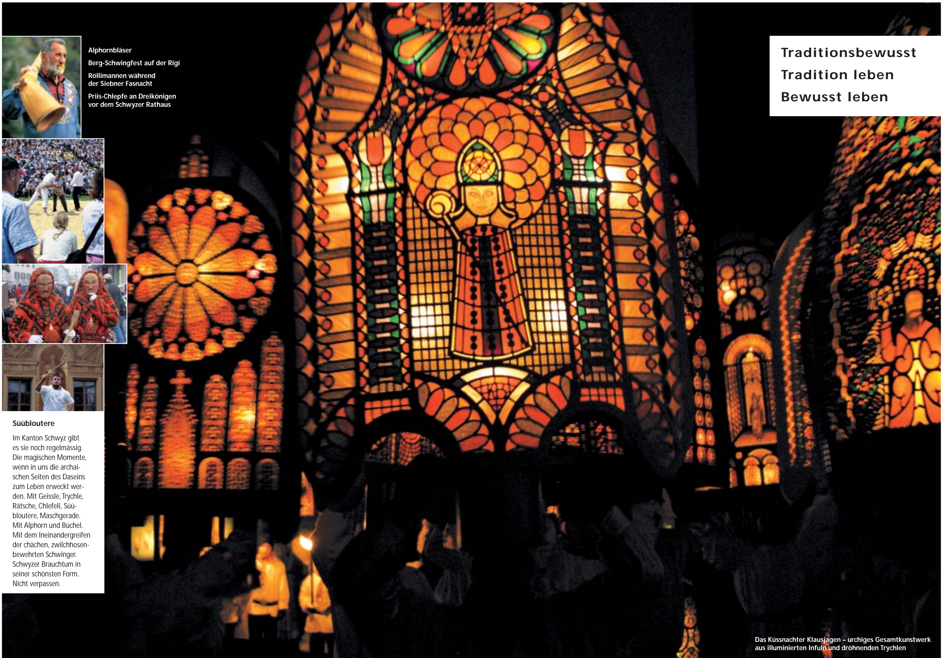
Das Küssnachter Klausjagen – urchiges Gesamtkunstwerk aus illuminierten Infuln und dröhnenden Trychlen

Traditionsbewusst Tradition leben Bewusst leben