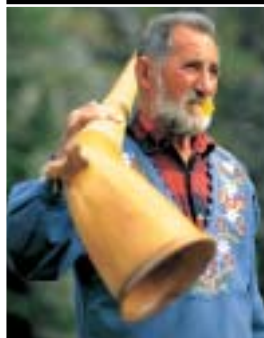
Alphornbläser Berg-Schwingfest auf der Rigi Röllimannen während der Siebner Fasnacht Priis-Chlepfe an Dreikönigen vor dem Schwyzer Rathaus